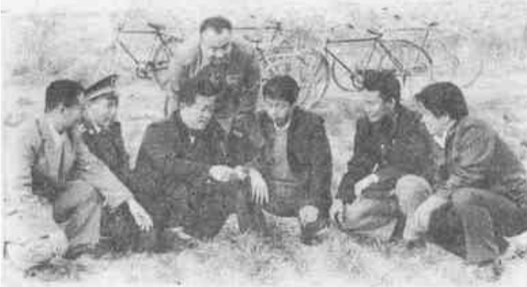
党委一班人深入田间研究工作。

随着畜牧业的发展，该乡先后形成了老鸡、新户两大牲畜市场，集日牲畜上市量达600多头，吸引了天津、河北等省市以及我省各地重多的客商来此交易，成交量在300头左右，贸易额达20万元。