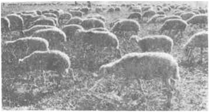
目前，全乡大牲畜存栏4000头，羊存栏18000只。

该乡是我省目前最大的文蛤繁育生产基地。这里生产的文蛤其表面花纹绚丽，蛤肉肥美鲜嫩，有“天下第一鲜”之美称。近年来，这个乡把文蛤人工暂养当作一项科技攻关项目获得成功。此项目已被列为国家级重点科研项目，为文蛤资源的开采开辟了广阔的前景。